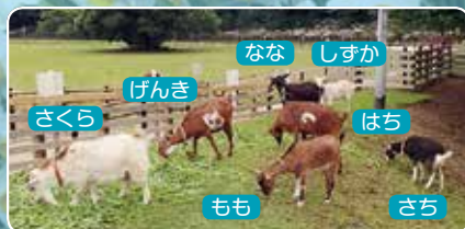
なな しずか げんき はち もも さち