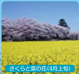
さくらと菜の花(4月上旬)